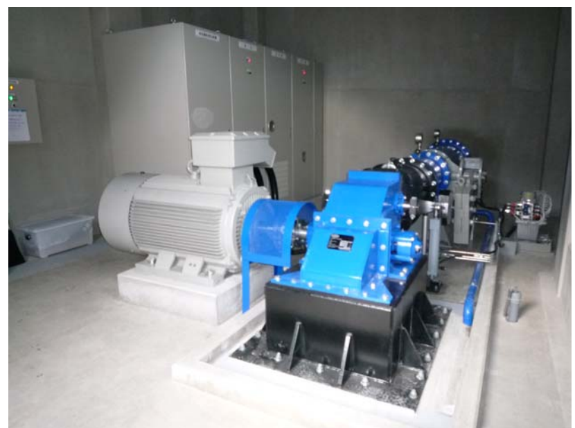
③ 小屋の中に入っているクロスフロー型水車