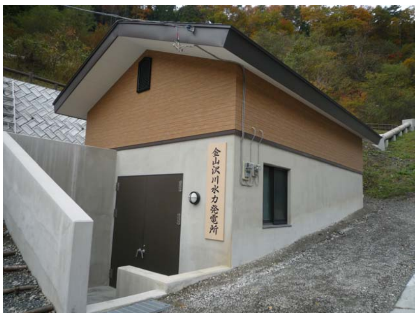
② 発電所の小屋 (中に発電設備が入っている。)